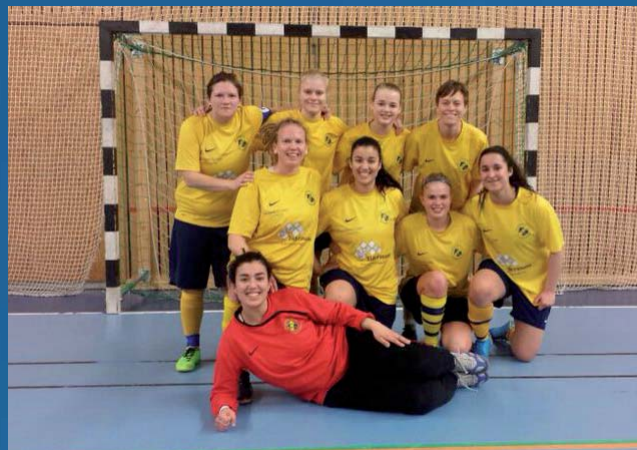
Vinnarlaget under futsal SM på damsidan.