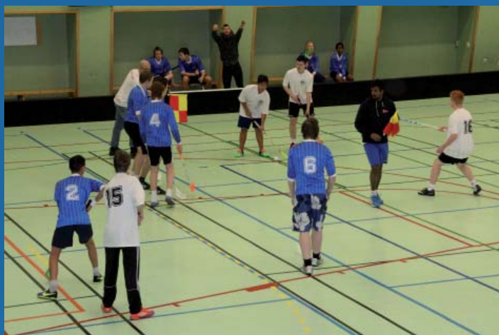
Lagen är beredda att köra igång innebandymatchen under Skol-SM i Härnösand.