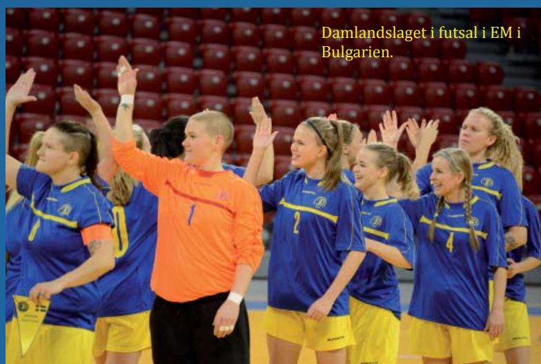
Damlandslaget i futsal i EM i Bulgarien.