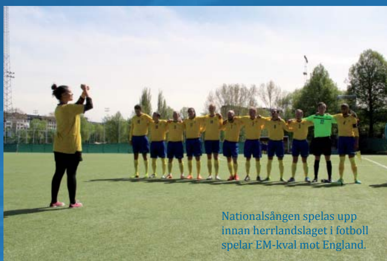
Nationalsången spelas upp innan herrlandslaget i fotboll spelar EM-kval mot England.