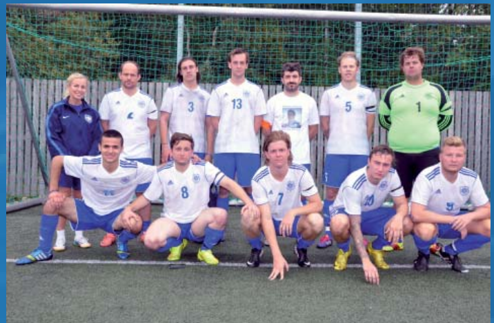
Vinnarlaget IK Surd under fotboll SM