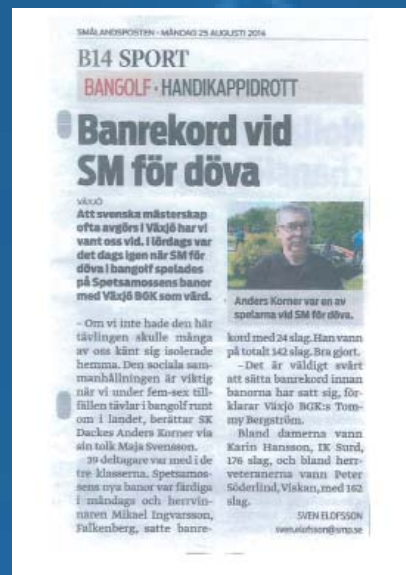
Tidningsurklipp från Smålandsposten