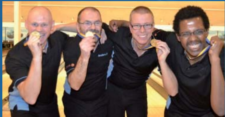
Stolta medaljörer under bowling SM.