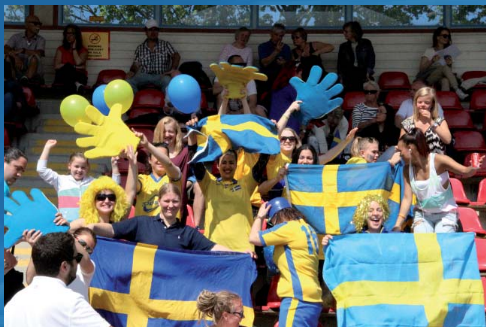
Svenska supportrar under EM-kvalet mot Belgien i herrfotboll.