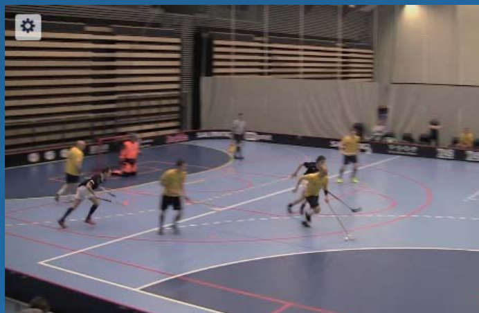
IK Hephata vann med 2-1 i finalen mot IK Surd under innebandy SM.